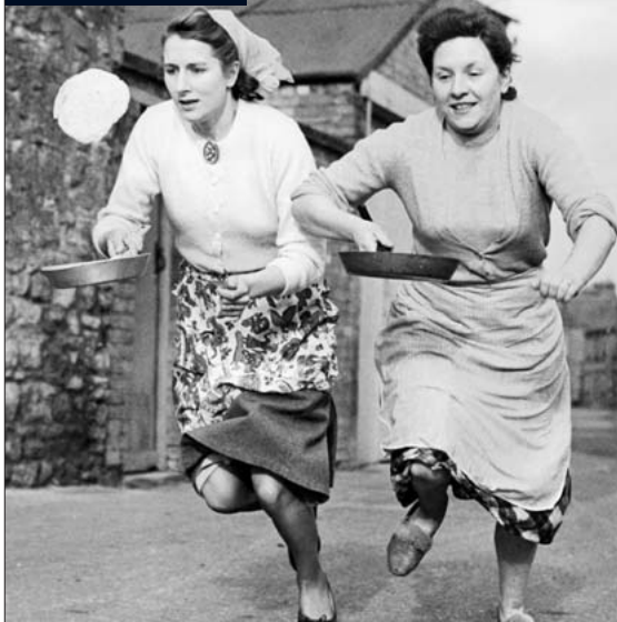
Zurück an den Herd