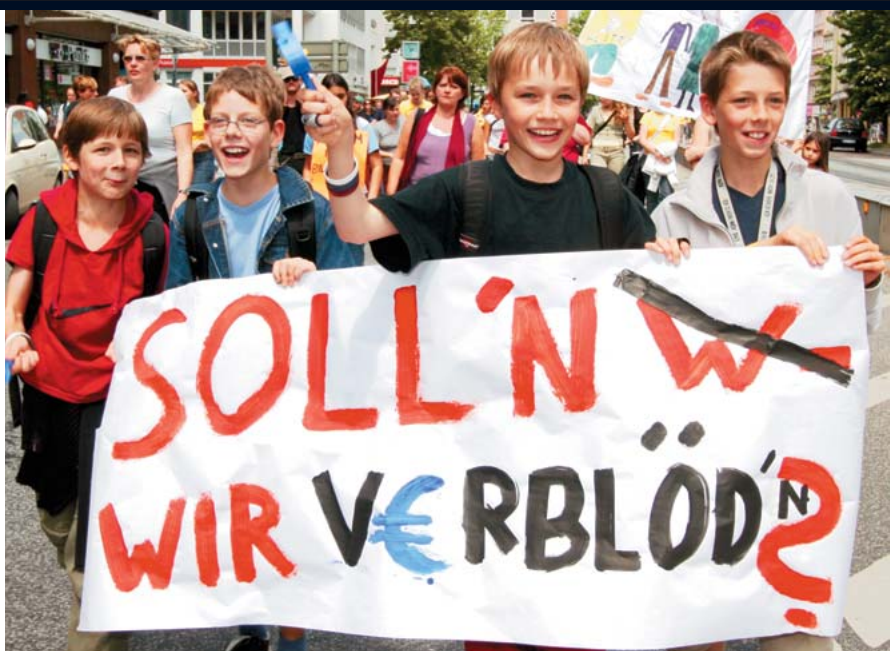
Bildung ist keine Privatsache

SPD, Grüne und Linkspartei setzen dagegen auf eine Verbesserung der öffentlichen Angebote. Sie lehnen Studiengebühren ab und wollen kleine Kinder gezielt fördern. Die SPD plant die Einrichtung von 230 000 zusätzlichen Kitaplätzen bis 2010, die Grünen wollen das letzte Jahr vorm Schuleintritt gratis anbieten. Die Linkspartei fordert eine kostenlose Ganztagsbetreuung für alle Kinder.